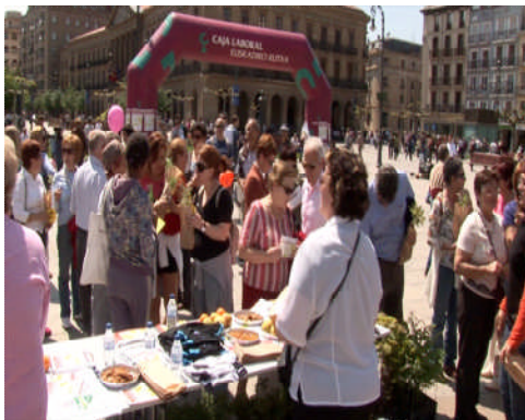
Marcha del día Internacional Fibromialgia que realiza

Y más de 15.000 a través de la página web